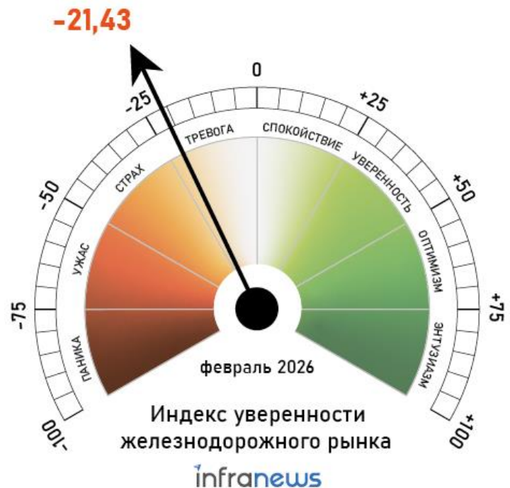
Рисунок 1 Индекс уверенности железнодорожного рынка в феврале 2026 года, InfraNews

Более того, операторы указывают, что после длительного простоя вагонам требуется ремонт, цены на который резко выросли, в то время как ряд вагоноремонтных предприятий уже прекратили свою работу из-за отсутствия заказов в последнее время. Ситуация близится к тому, что операторам будет проще и дешевле купить новый вагон, нежели отремонтировать имеющийся, предупреждают собственники подвижного состава, а некоторые из них прямо заявляют, что ни на то, ни на другое у них уже нет денег. В результате себестоимость предоставления подвижного состава в ближайшем будущем будет только увеличиваться, что в купе с ростом железнодорожного тарифа повлечет дальнейшее снижение погрузки и отток клиентов с железной дороги на другие виды транспорта, прогнозируют участники рынка.